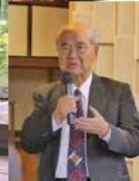
レクチャーplus No.11 「自然との共生 ～日本文化の中核思想～」 松浦晃一郎氏