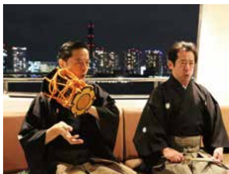
「横浜 三日月Nightクルーズ ～鼓と波～」の様子

アーティストの各種コラボレーションによる新たな表現を 追求する各種イベント、展覧会、企画展を開催します。