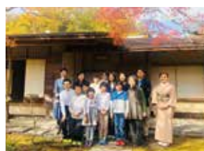
伝統文化こども教室 「錦秋茶会」

《レクチャー Plus》とは、特別な 講師によるレクチャーだけではなく京都や国内の貴重な場所での 開催や伝統の美味を味わったり、アーティストから直接指導 が受けられるなど、特別な体験 がセットになった勉強会です。