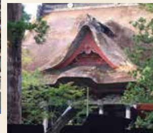
第二回 「自然と信仰が息づく “生まれかわりの旅” -日本遺産・出羽三山-」の様子(山形県)