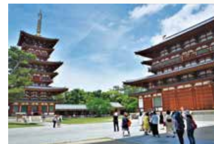
第三回 「鑑真和上が運んできた仏教と芸術。奈良悠久のみち。」 の様子(奈良県)

アーティストとともに国内外の作品の舞台 や現場などを歩き、表現が生まれる原体験 を得るツアーを企画・開催します