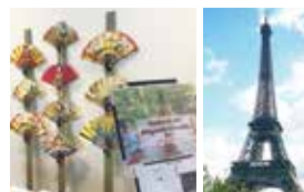
「KYOTO ET SON ÉLÉGANCE ÉTERNELLE 京都永遠の雅」の様子